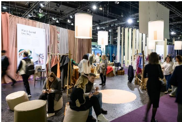
Heimtextil: Hotspot für textiles Interior Design.

Ergänzend dazu warten im direkten Umfeld in der Halle 11.0 die aktuellsten Trends, Entwicklungen und Produkte rund um das Thema Schlaf. Der Bereich Smart Bedding ist die zentrale Plattform für innovative Schlafsysteme, Bettwaren und -decken, Kissen, Matratzen sowie Maschinen für die Textilverarbeitung. Hier präsentieren Rückkehrer wie Billerbeck (Schweiz), KBT Bettwaren (Deutschland), Setex Textil (Deutschland) und Grasim Industries - Aditya Birla (Indien) sowie Aussteller wie Hefel Textil (Österreich), John Cotton Europe (Polen), Lenzing AG (Österreich), OBB (Deutschland), Standard Fiber (USA) sowie Traumina (Deutschland) ihre breite Angebotsvielfalt.